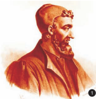
图 1 Claudius Galen