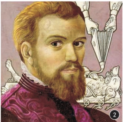
图 2 Andreas Vesalius