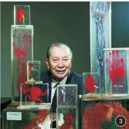
图 3 钟世镇院士和他的管道铸型标本

临床医生从医学院毕业走入病房后,解剖学知识仍停留在医学生时期学到的内容,没有与临床很好地结合。当临床中遇到困惑时,只能从解剖书籍和图谱中寻找答案,这种模式很大程度上限制了临床医学尤其是外科技术的发展。随着现代医学的发展,新技术、新术式在应用于临床之前,需要在解剖标本上验证其可行性、安全性、实用性。